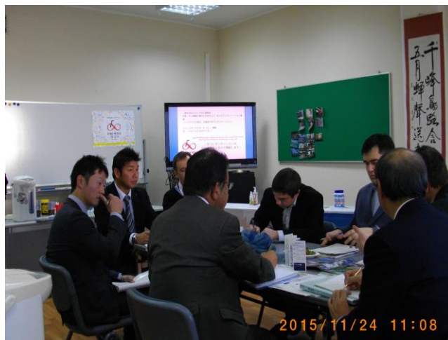
ハバロフスク地方、沿海州でのプレゼンテーション②