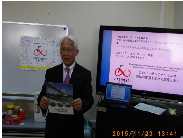
ハバロフスク地方、沿海州でのプレゼンテーション①