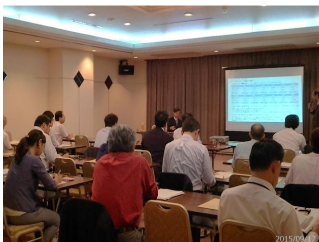
ロシアビジネスセミナー in 秋田 —プーチン大統領訪日の動きのなかで—