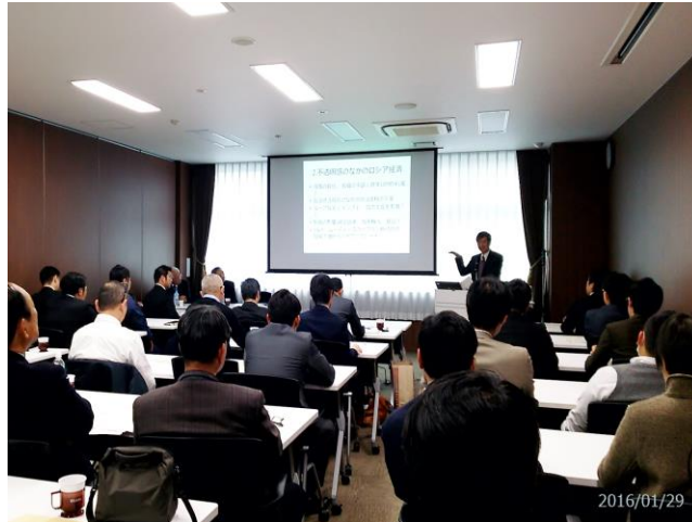
ロシアビジネスセミナー in 徳島 —激動する世界情勢のなかで—